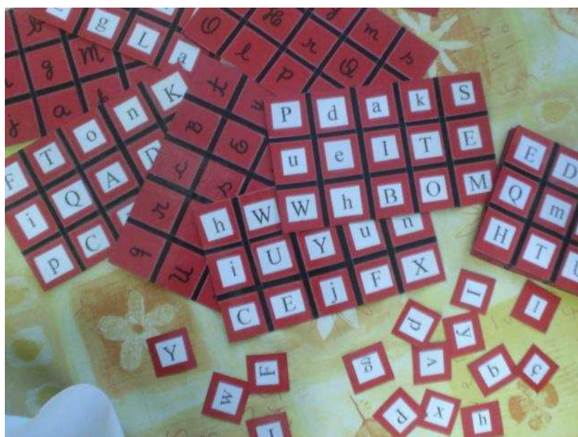
Figura 1: bingo de letras

Assim, com esses “olhares observadores”, vários jogos foram criados. Eles serão descritos na seção seguinte, “Resultados e Análise”.