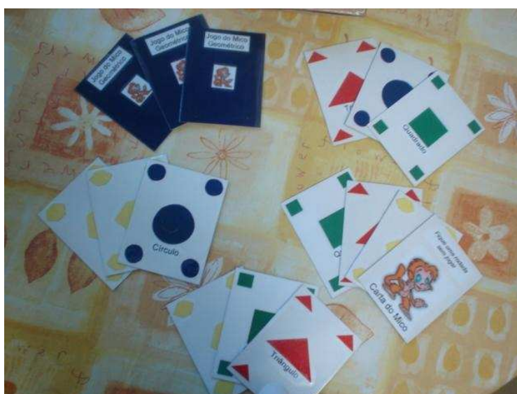
Figura 5: jogo do Mico Geométrico

Outro jogo bem chamativo, e que também foram feitas adaptações a partir de um jogo já existente, foi o jogo do “Mico”. Nesse caso, montamos o jogo do “Mico Geométrico”, que funciona seguindo as regras do jogo tradicional. Dando-se, entretanto, ênfase ao estudo das figuras geométricas. Esse jogo foi criado por uma aluna do curso de matemática, durante seu estágio.