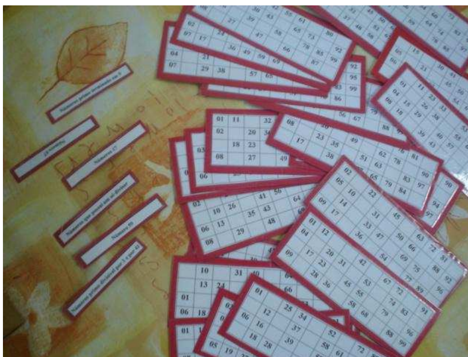
Figura 13: Bingo de números

Este artigo se finda com a exibição dum outro modo de trabalhar o jogo do bingo. Desta vez, a pessoa, que cantará o bingo, não falará o número exato a ser procurado nas cartelas, mas sim uma operação. Os participantes do jogo têm que resolver a operação e procurar o resultado nas suas cartelas. Esse é um jogo que pode ser utilizado, em qualquer série, basta aumentar o nível de complexidade.