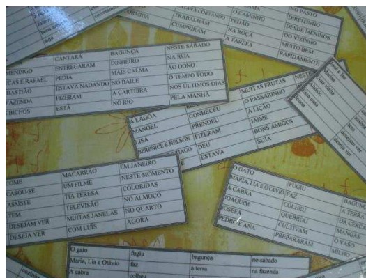
Figura 7: jogo de Frases

Um outro jogo confeccionado foi o de sílabas. Para o mesmo utilizamos cartelas de papel colorido e figuras recortadas de revistas. A palavra foi dividida em sílabas e coladas em pedacinhos de papel, quando o vocábulo era mais complexo, colamos uma sílaba na cartela, de modo a facilitar. A criança deverá encontrar as sílabas correspondentes a cada palavra e montar na cartela.