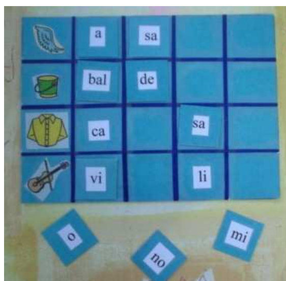
Figura 8: jogo de sílabas

Um outro jogo confeccionado foi o de sílabas. Para o mesmo utilizamos cartelas de papel colorido e figuras recortadas de revistas. A palavra foi dividida em sílabas e coladas em pedacinhos de papel, quando o vocábulo era mais complexo, colamos uma sílaba na cartela, de modo a facilitar. A criança deverá encontrar as sílabas correspondentes a cada palavra e montar na cartela.