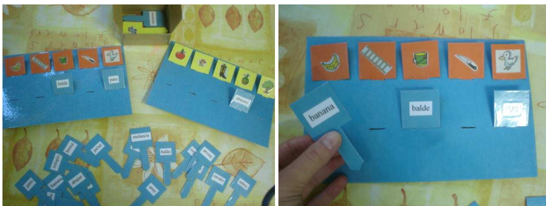
Figura 11: jogo de figuras e palavras

O jogo abaixo tem como objetivo encaixar cada palavra na figura correspondente, ou, se a professora preferir, pode colocar na parte superior os nomes e as crianças tentarão descobrir a figura. Novamente, nesse jogo, as cores fortes estão bem presentes. É uma aposta que fazemos, pois acreditamos com isso conseguir prender um pouco mais a atenção da criança.