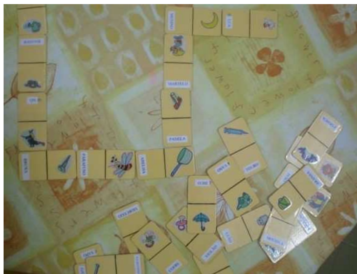
Figura 9: dominó

O tradicional dominó também foi modificado, ao invés de colocar duas figuras iguais, buscou-se colocar uma figura e seu nome. As pedras foram montadas em restos de fórmica que foram doados. Esse pode ser um material difícil de ser encontrado, mas pode ser substituído por papelão, é a intenção de reaproveitar tudo o que for possível.