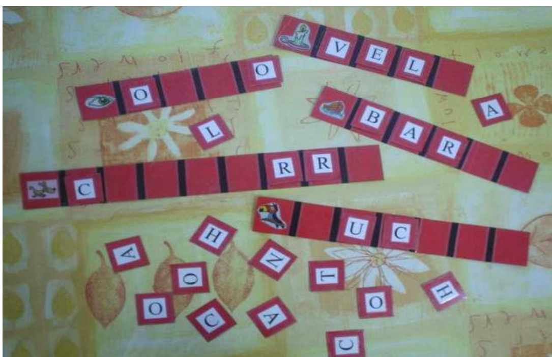
Figura 12: montando palavra

Outra opção para o início da alfabetização é a montagem de palavras de um modo bem simples, como o que pretendemos na figura a seguir: