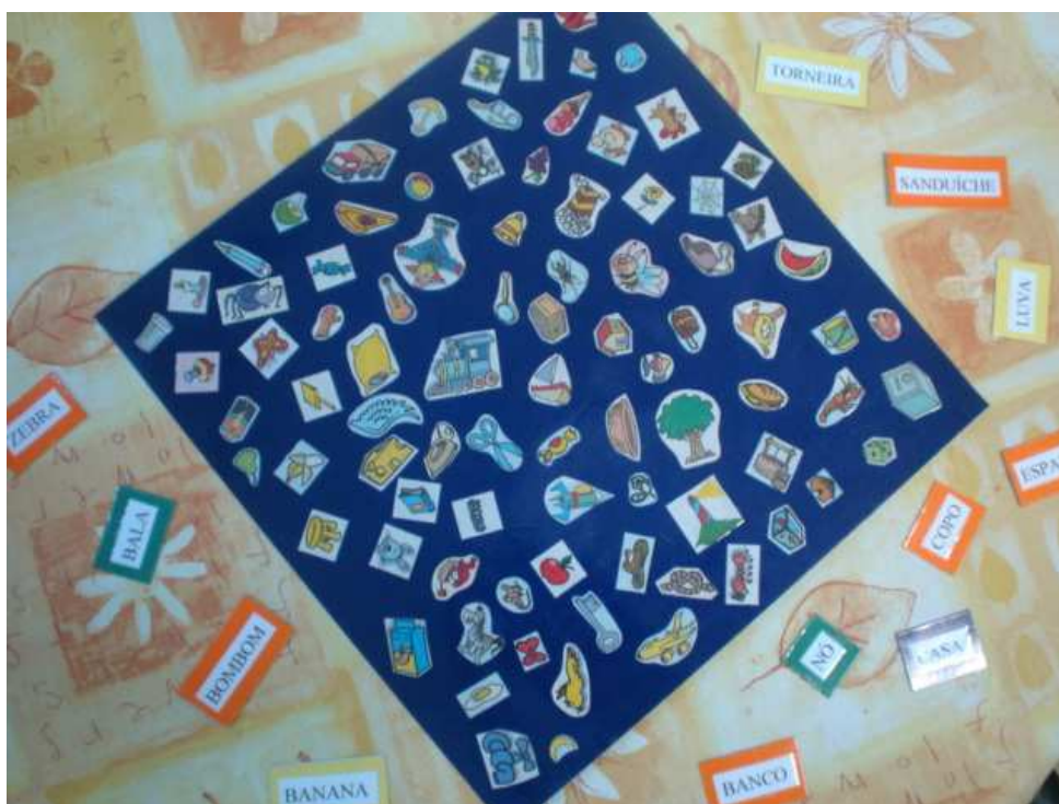
Figura 4: lince

Outro jogo bem chamativo, e que também foram feitas adaptações a partir de um jogo já existente, foi o jogo do “Mico”. Nesse caso, montamos o jogo do “Mico Geométrico”, que funciona seguindo as regras do jogo tradicional. Dando-se, entretanto, ênfase ao estudo das figuras geométricas. Esse jogo foi criado por uma aluna do curso de matemática, durante seu estágio.